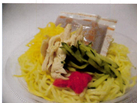
木曜日 ごまだれ冷し中華