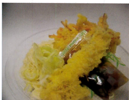
月曜日 天ぷらきしめん