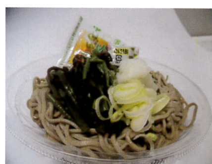
水曜日 おろしそば